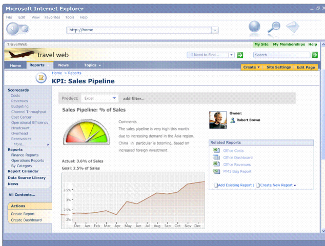
Exemple de l'interface du Centre de rapports