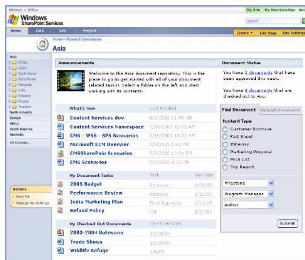
Référentiels de documents évolutifs

Tirez un meilleur parti de votre contenu en fournissant un contrôle complet sur le stockage, la sécurité, la distribution, la réutilisation et la gestion de documents et autres contenus électroniques, comme les pages Web, les fichiers PDF et les messages électroniques.